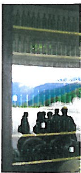
Unterirdisch in Kaltern: Eingang und Verkostungsraum der in den Weinberg gebauten Kellerei des Weinguts Manincor (rechts) | Le verre capricieux : Außenansicht des Weinbistros im Weingut Elena Walch (unten)

Eine Besonderheit in Südtirol ist das Törggeln, eine Tradition, die aus dem Eisacktal stammt. Man wandert im Spätherbst zu den Höfen der Weinbauern, um dort – begleitet von kräftigen bäuerlichen